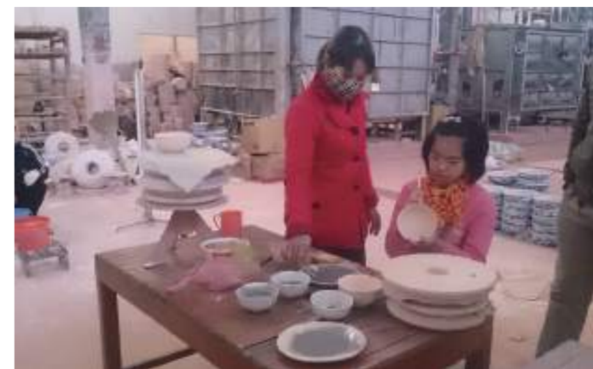
陶瓷工廠學習體驗