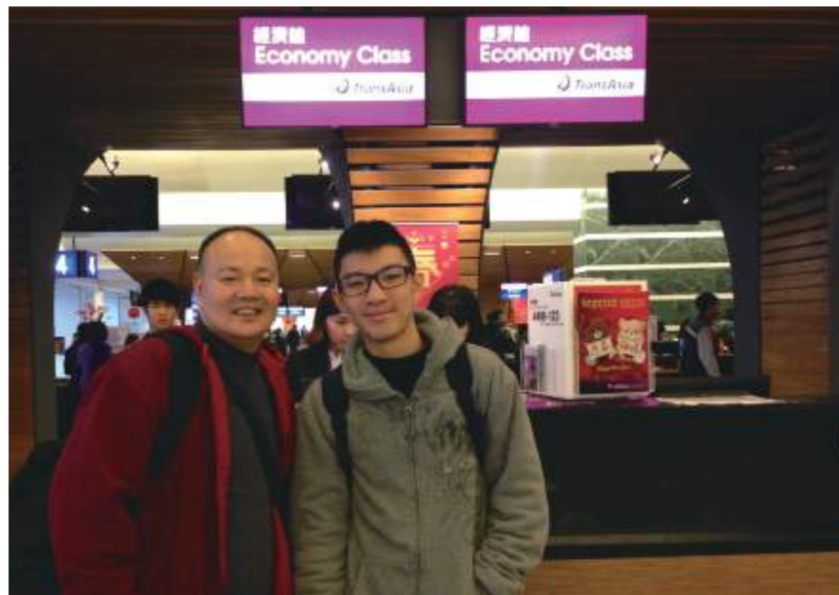
1/30 好開心！要出發了！在機場的航空公司櫃台要 CHECK IN 了