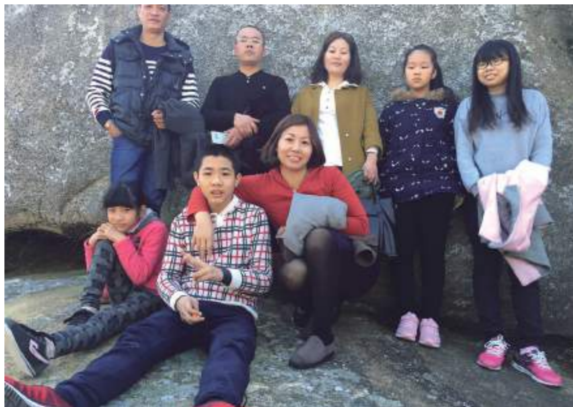
跟家人一起去南寨山廟宇拜拜