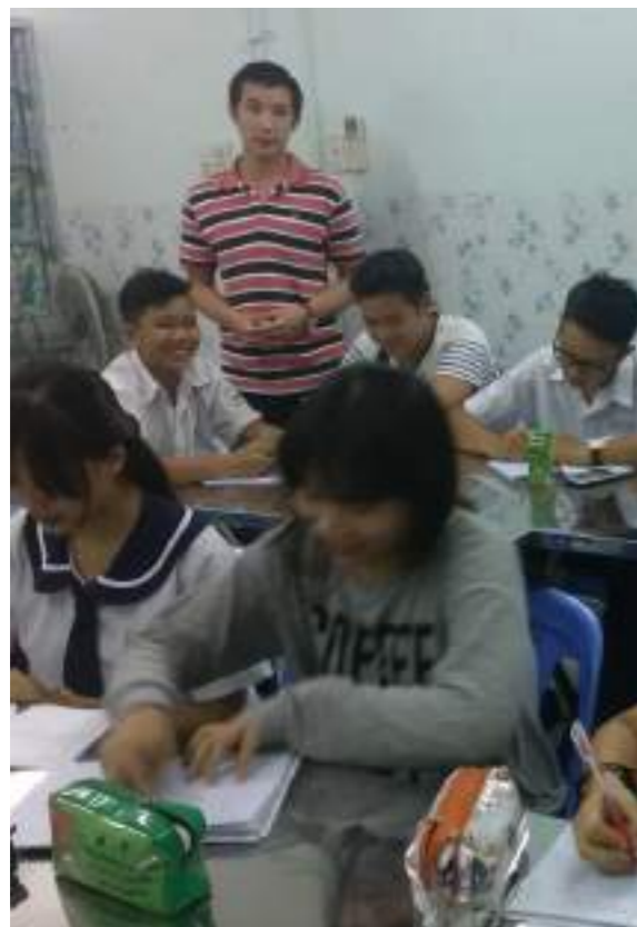
在表妹補習班拍的，站著的人是我，其他人是補習班的同學。