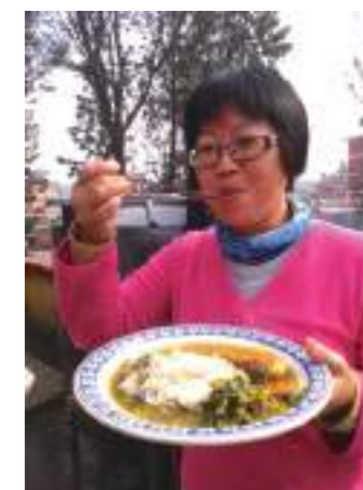
老師品嚐阿嬤親手烹煮的家常咖哩雞，咖哩香氣誘人，大家吃到都停不下來。

將成果彙編的影片公開在全校朝會播放，並將尼泊爾地震後的重建過程透過實地的攝影及訪談，完整呈現給眾人，希望能夠獲得更多外界的協助，讓尼泊爾貧困的現況能夠獲得長期的援助。