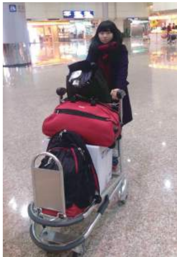
今年是第一次回媽媽的故鄉河北唐山過年，桃園機場出發