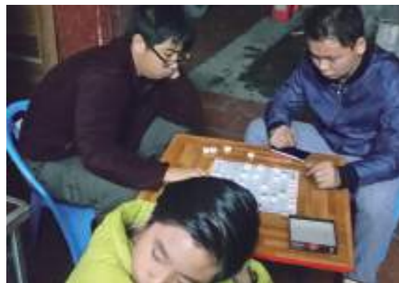
回娘家鄉下和表哥一起 PK 象棋