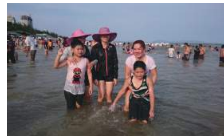
新住民學生和媽媽在越南胡志明市海邊戲水

跟著媽媽這一次回到越南，感覺到媽媽非常的開心，從知道得到這個計畫補助能夠回去媽媽每天都很興奮，每天我們都計畫著回越南要到那些地方去，想到媽媽是這麼勇敢一個人到臺灣，離開她的爸爸、媽媽到一個她生活和語言完全不一樣的地方，要工作和照顧我們兄弟非常的辛苦，媽媽每天都工作到很晚才回到家，我雖然沒有了爸爸，但已經六年級了，我要更懂事和孝順媽媽，如果長大賺錢，一定要讓媽媽可以隨時想回越南都可以回來。