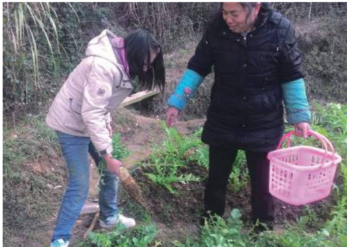
外婆家的田地，幫忙拔蘿蔔，我與外婆。這天氣晴朗，我興致勃勃地跟著外婆來到菜地，我按照外婆叫我的方法，蹲下身子，用雙手握住蘿蔔的葉子，然後用力往上一拉，很幸運，一根又大又長的白蘿蔔出現在我們的眼前……