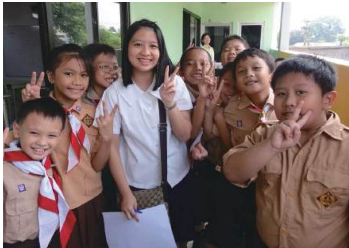
心榆與 Amore Prime School 學生校園合照