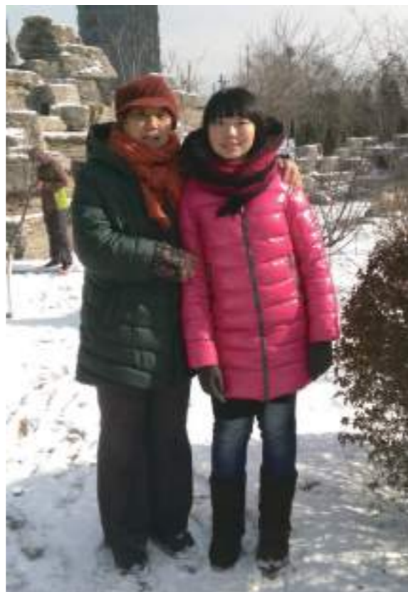
聽說北方會下雪，很期待。回去的當天，到北京機場已經在飄雪了，當時興奮的無法形容，回到姥姥家的隔天，雪下得已經很厚了。雪中和姥姥的合照。