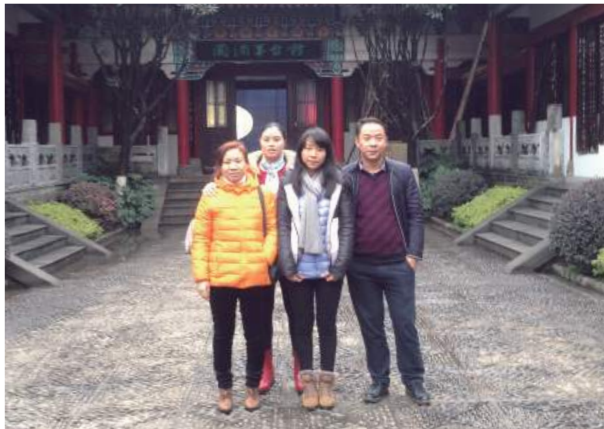
與舅舅和舅媽參觀國酒文化城，了解到國酒的發展歷史還有許多有趣的飲酒文化