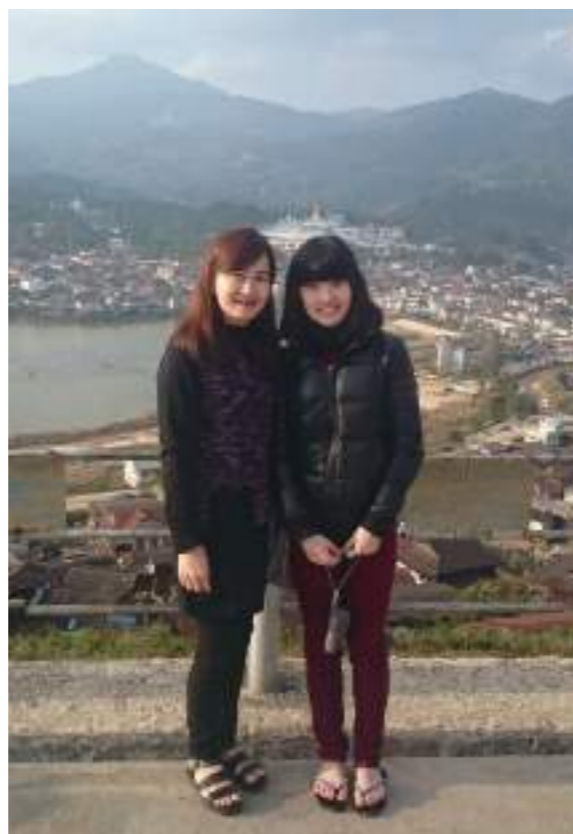
摩谷的四面佛，摩谷是一個盆地，我們去的四面佛是其中一座山，