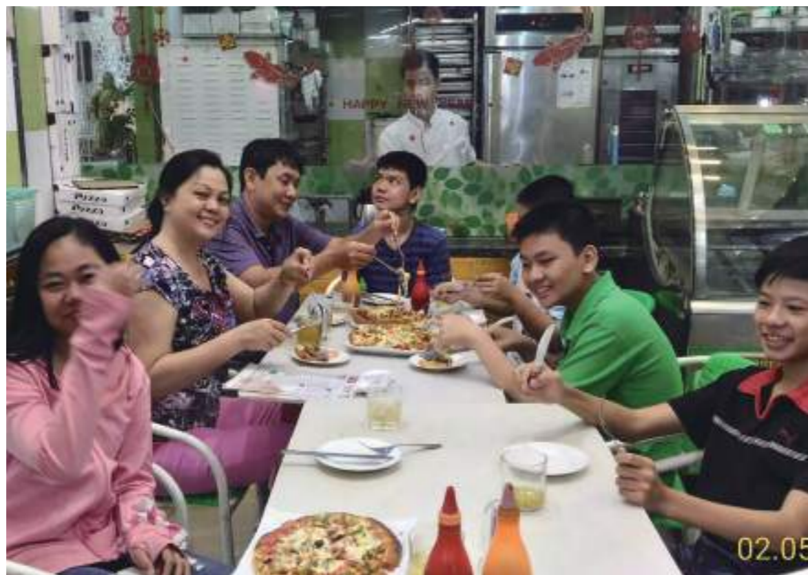
和朋友一起用餐大家很開心，我和他們溝通時都用越南語講