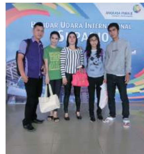
離開印尼前的送機

於回臺灣後一週內以口頭、照片方式呈現，敘明親友概況描述、生活狀況、雙方異同等。以身歷其境的生動口語簡報，加上電腦及投影機撥放照片及影片，讓同學瞭解本次交流學習計畫的內容。分享兩地生活的異同。鼓勵同學珍惜幸福，努力上進。期勉同學把握機會，努力爭取交流學習的機會。以「古早味廟會」方式進行分享，營造社區民眾凝聚力。由學生聯絡簿宣傳、里長廣播等方式宣傳，或配合元宵節節慶活動進行。學校也將於母親節前舉辦母親節慶祝大會暨親職教育活動，歷年家長參與熱烈。於本活動中安排上臺分享，必定能達到良好的宣傳效果。