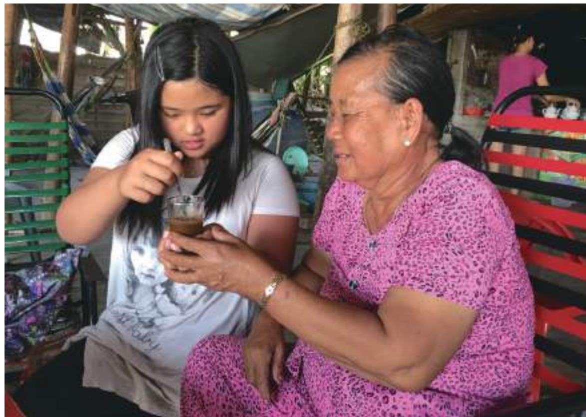
陪外婆喝她最喜歡的咖加煉乳。