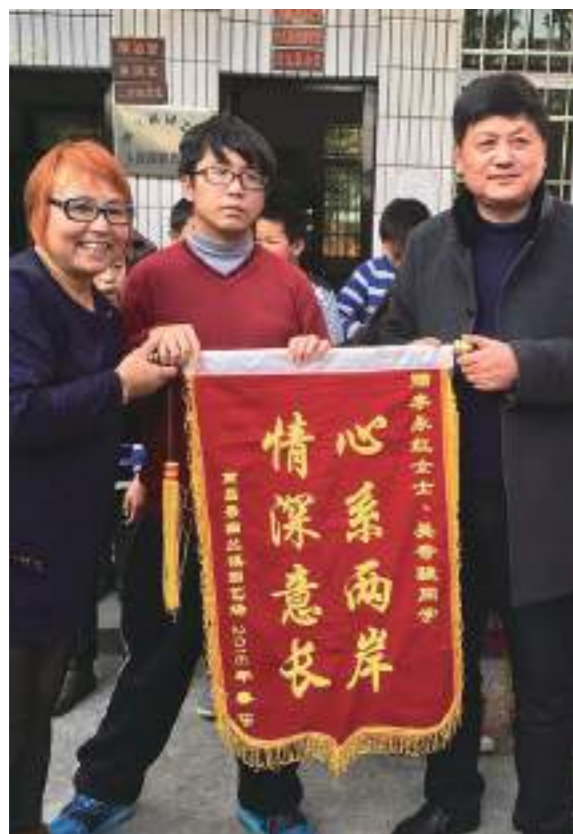
帶著臺灣社會的愛，送上裝著滿滿幸福的福袋到醫院看望病友，也得到了醫院領導的肯定及鼓勵。