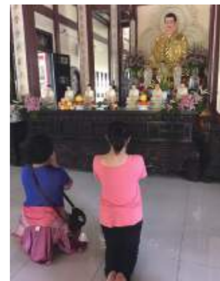
祭奠外婆（外圍佛堂）照，圖中人物分別為我和三阿姨。

相對於現在人人手一支智慧手機、遇到事情就滿口抱怨或甚至直接當個甩手掌櫃的情況，前人卻是經歷各種難關，不惜付出一切才得到如今的和平現世。珍惜自己所有並感念前人的付出，然後盡一切所有讓現在更好，方能不愧對前人。