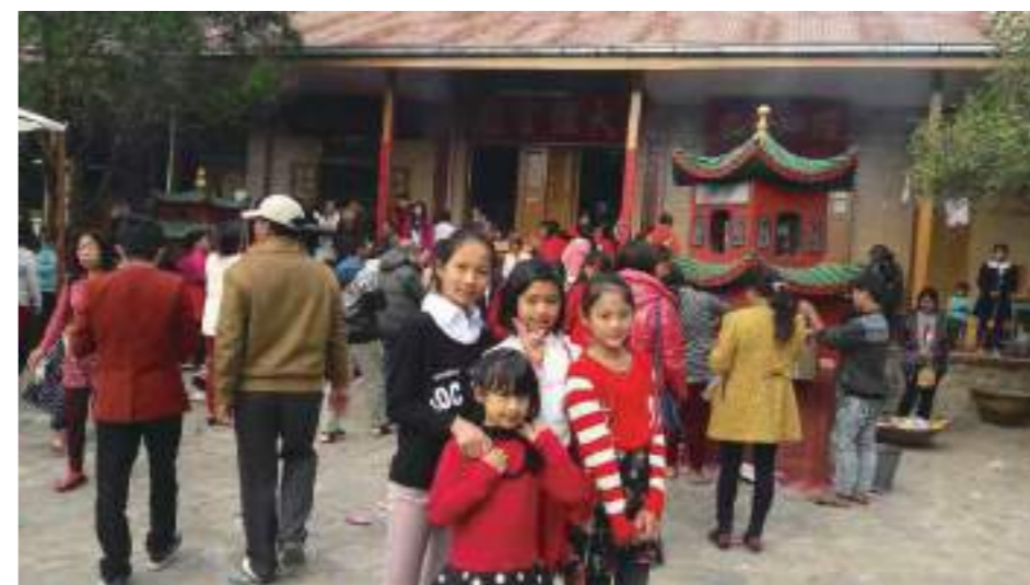
緬甸華人大年初一都會帶著全家老小去觀音廟祈求一年的平安。

也希望跟同學們分享這次緬甸經驗之後，他們可以更了解緬甸這個國家，其實離臺灣很近，比我們從小聽到的美國、英國和法國都近得多，但是大家都不知道在緬甸也有很多華人，跟我們有相似的習俗，也有因為生活的地方不一樣，而產生不同的文化差異。在腊戍去學到簡單的緬甸語和文字、和那裏的家人相處，也開啟了我學習緬甸文的動機，希望下次去緬甸見親人的時候，可以跟他們用緬文說更多話，之後和媽媽一起好好學習緬甸話！