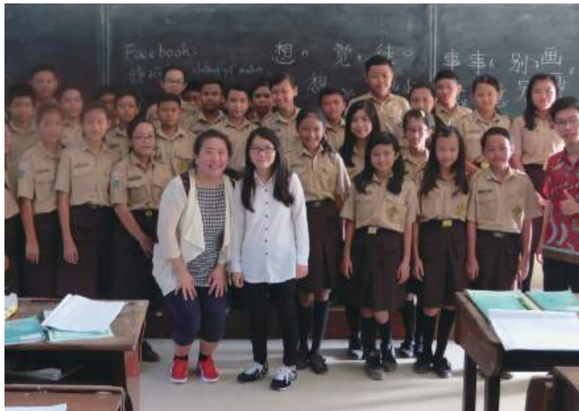
到怡萱表姊的學校 SMP Pengabdi Singkawang (山口洋當地天主教名校) 參觀，至七年級 (國一) 的中文課堂上，介紹台灣的國中生生活，做語言及文化交流，得到同學熱烈的回應。