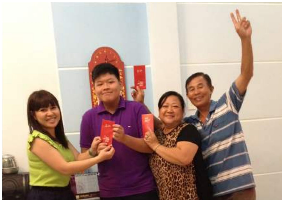
第一次返鄉過年，初一拿到大紅包，開心極了。