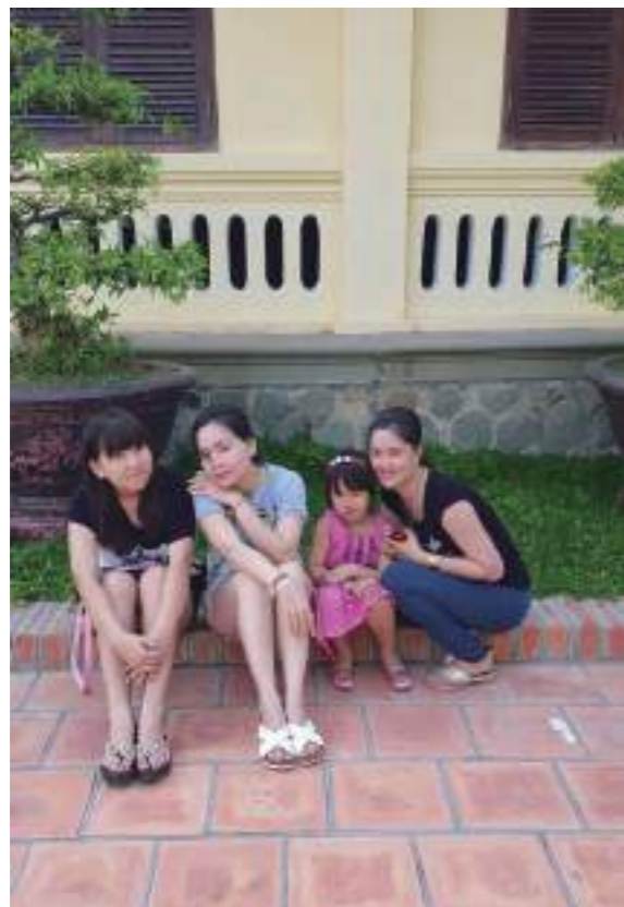
和家人參觀一間擁有百年歷史的古厝