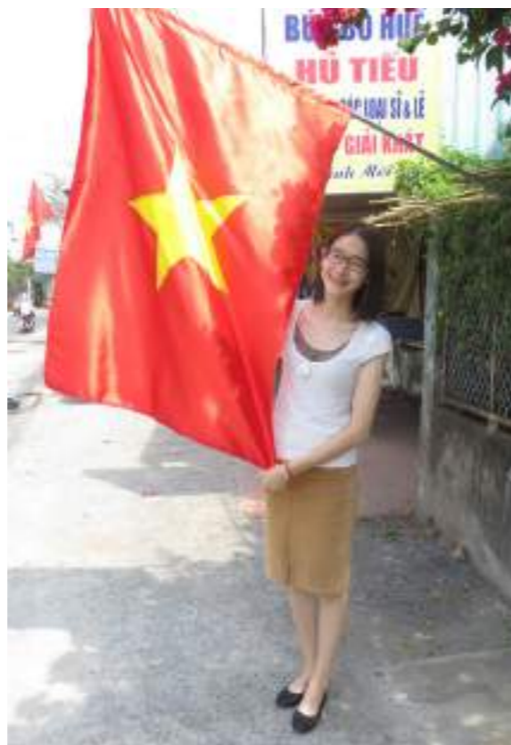
去向親戚們拜年在家外拍