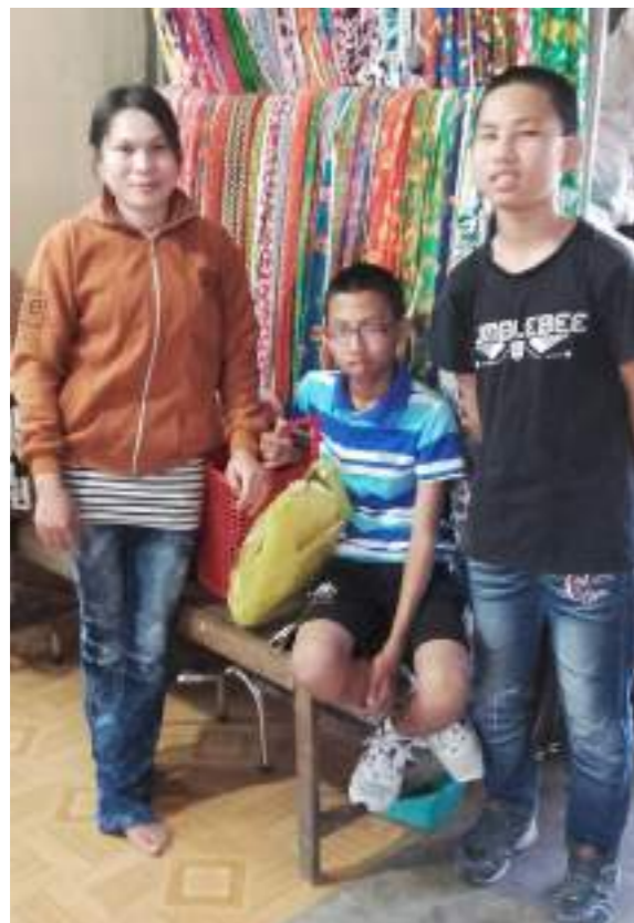
帶小孩逛市場，買布料