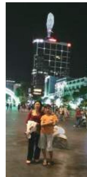
這是越南的市政府辦公的地方，它是越南最古老的建築，也是胡志明市的中心。

另外，藉由這次交流的機會，讓他們了解臺灣對從他鄉遠嫁到我國所受的照顧及幫助。母親和我說這次政府會辦這個計畫也是因為前一段日子越南發生排華事件，很多臺商因此受到很大的損失，所以才會有這次以東南亞國家嫁來臺灣所生的第二代為培育對象，希望以後在東南亞國家如再有相同事件發生，我們這些優秀的新住民二代能幫政府和對方政府溝通，減少政府和民間企業的損失。經由這次的返鄉活動，讓我更深入去了解越南，希望政府繼續辦理這項活動，讓更多的新住民第二代扮演溝通的橋樑，重新建立起臺灣和越南更深一層的友誼。