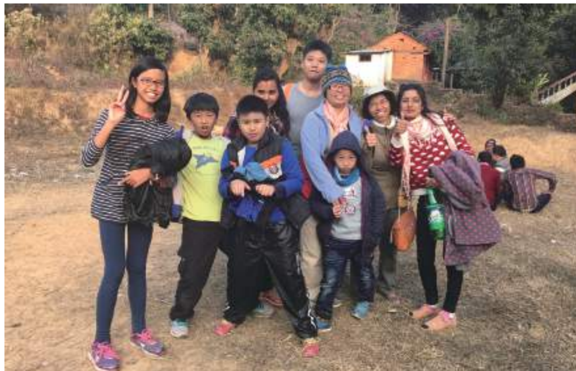
與當地師生一起野餐。在 Bandipur (地名) 的居民都是非常熱情，巧遇當地的學校老師和學生來野餐，飽足後，師生一起手足舞蹈，熱情的邀請我們參與，有位女學生牽著的維對舞，臺尼兩國師生相見歡，並品嚐野餐的在地餐點，超棒！