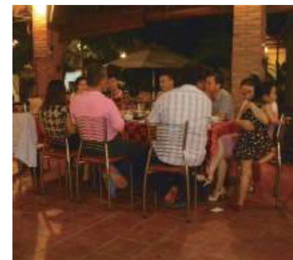
和家人一起吃年夜飯