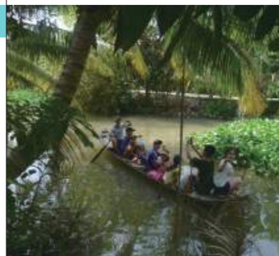
表哥划舢舨載我們遊河