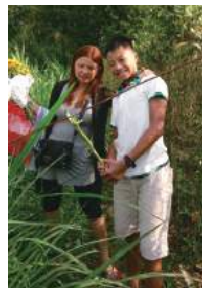
在越南的第二天，第一件事就是到外公以及祖先們的墳墓上香，而我們來的住要目的就是「探親」，並且請祂們保佑我們在這趟旅行中能夠平安順利。

雖然我從一出生就在臺灣出生，真正在越南生活的時間也很少，但是我的身體裡面也流著一半越南的血，所以就算我的人不在越南，我至少也有一半的心是留在越南的，有的時候還是會很想回去越南看看外婆、看看舅舅他們，我想這份想念的心，媽媽跟我都是很相像的，在越南的的外婆一定也不例外，一趟省親之旅讓我的心靈有更加強烈的歸屬感。但是媽媽可就不同了，因為媽媽在越南土生土長，到了二十幾歲才嫁來臺灣對她來說，應該是個較難克服的問題，畢竟要離開一塊從小陪伴到大、身有感情土地，要另到外一個陌生的土地，我想論誰都會不習慣的，對媽媽的影響滿大的，這次媽媽能回去拜拜，看親人，我認為對她來說應該是非常開心的一件事。