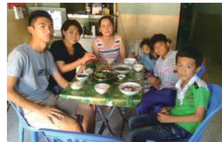
外公烤乳豬請大家吃飯