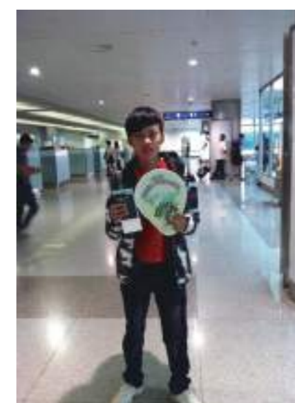
行程結束，從越南機場搭機，準備回台灣