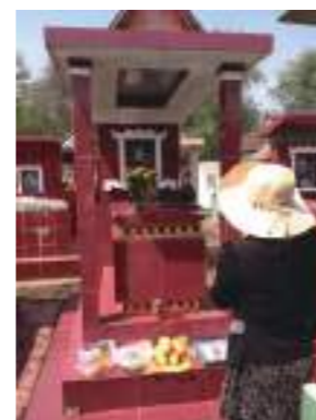
因越南清明節是農曆過年 25 號。要給祖先掃墓

對於我們新住民家庭而言，回家的旅費支出真的是一筆不少的開銷，更何況對於單親撫養孩子的我更是一筆可觀的費用，在此還是感謝政府提供這次機會，真的很感恩，嫁來臺灣十多年了這還是第一次返鄉過年，第一次種子的火苗真的點燃的是我們新住民家庭的希望與未來，影響的更是無法言語形容的深遠及重大。