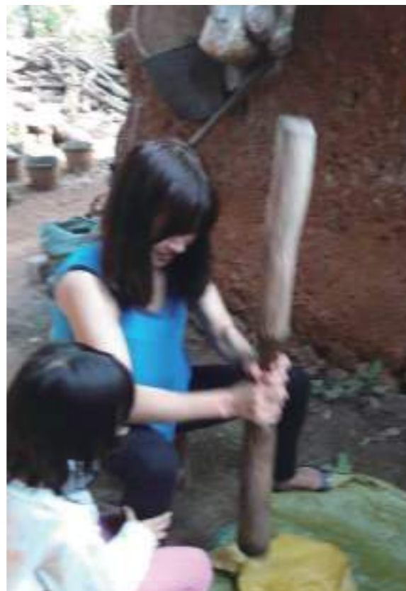
緬甸華人的習俗在過年兩天前每戶人家都會做粿粿在過年之間吃。