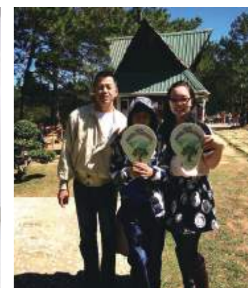
參觀越南大勒風景區