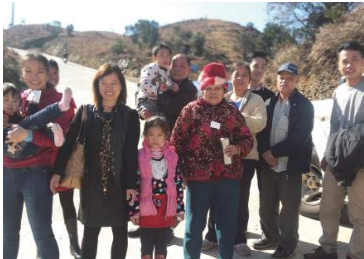
與外婆以及親戚們出外遊玩溫馨大合照