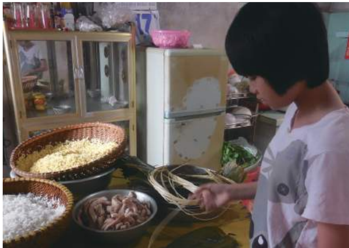
越南過年要拜粽子，在體驗包粽子