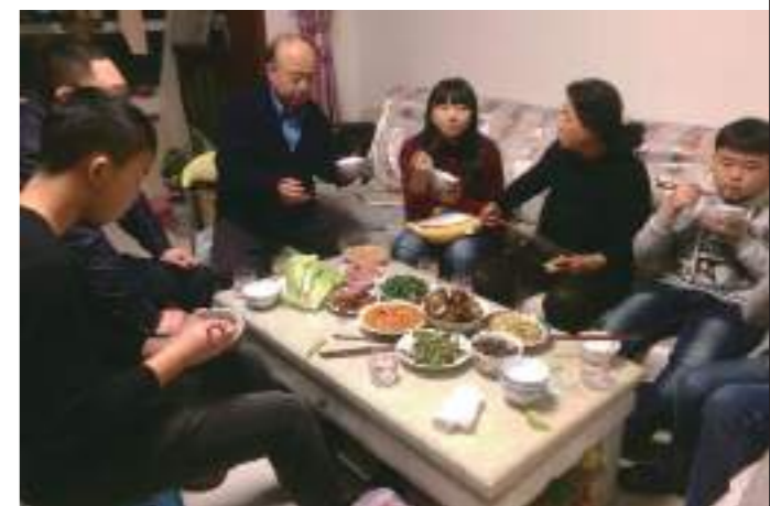
回到姥姥家的第一餐，姥姥和阿姨準備了豐盛的唐山菜招待我們。

這次大陸行探親非常有意義，是我長大懂事在大陸第一次過年，體驗燒柴做飯，自己做皮包水餃，體驗睡在炕上，到傳統市場陪姥姥去買菜。這二十天美好又難忘，感謝大陸親人們的關心愛護，真得很捨不得親人們。回到臺灣我會謹遵像親人們囑託的，我會更加努力學習生活，朝著目標前進，考上理想的大學，期許下一次的相聚。