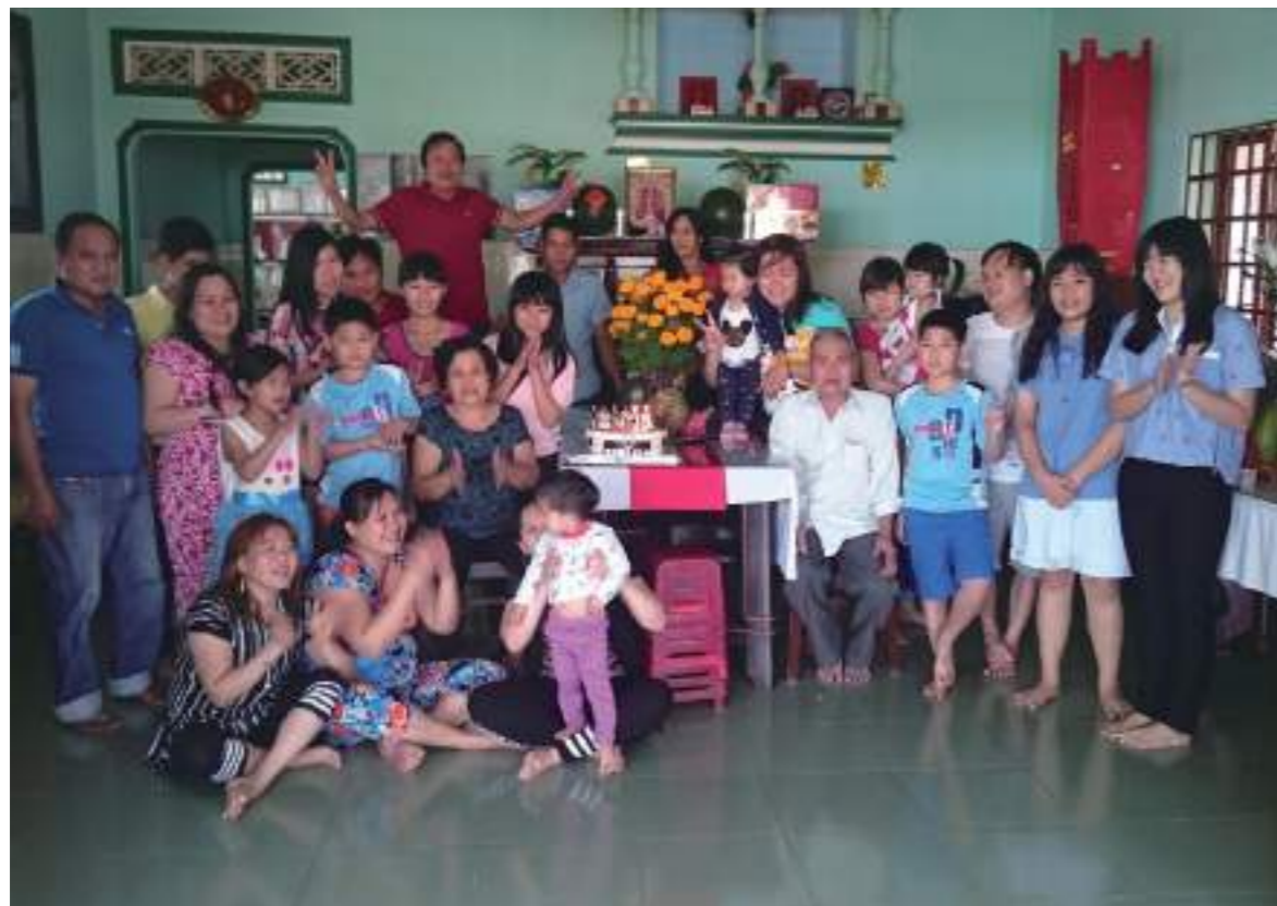
新住民學生回越南家鄉娘家全家福照