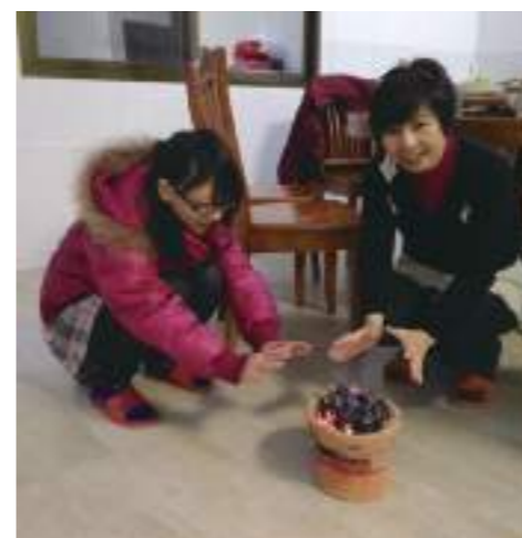
過年圍爐真有火爐！媽媽竟也是看到火爐才想起圍爐是真是其「爐」，兒時記憶頓時湧現……。

而我希望留給他們的就是環保意識。猶記在克拉克遺址的美麗風情底下，是遊客帶來遍地的垃圾，塑膠瓶、鐵鋁罐隨處可見，他們認為習以為常的景像，我卻覺得怵目驚心。雖然他們已經在推行「文明城市」、「垃圾不落地」，但顯然宣導只是為輔，風景區多加設垃圾桶或許更有效益。我和親友分享了臺灣的環保措施，有些人聽進心裡、有些人不以為然，但無論如何，我都希望環保的觀念至少能像種子一般種進他們心裡，從自身做起進而影響他人，改變世界對於「中國人不環保」的印象。