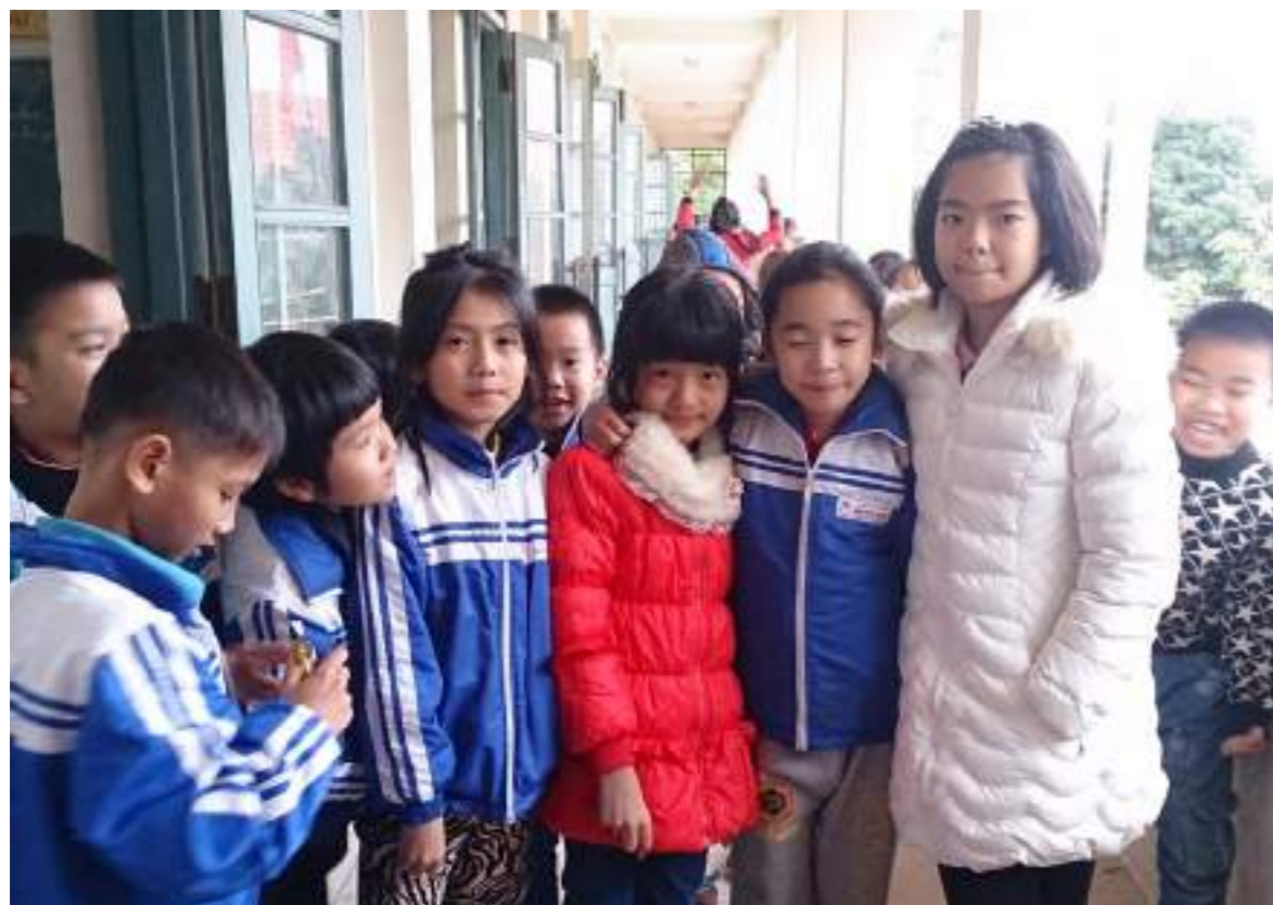
到越南阮平國小與同學合影留念