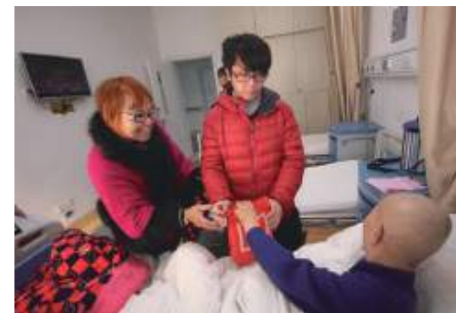
去醫院探望不能回家團聚吃年夜飯的病友。

17號在中港高中502班分享的影響效果就更棒了，我們把從對岸帶回的小禮物，分送給同學時，老師和同學們都很讚嘆，異口同聲說：「下次要號召更多的同學來一起參加送愛的行列，現在要好好讀書，將來可以用自己的能力，為社會帶來更多的陽光和愛，也可以做更多有意義的事！」所以這次的成果，影響了同學的社會觀和人生的價值觀。