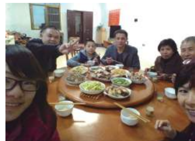
除夕夜吃圍爐飯囉！一桌豐盛的菜餚，由大姨精心烹煮。十道菜，象徵十全十美，當然免不了要有當地特色名菜——鹹水鴨。