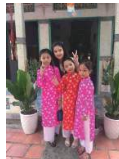
我跟表姊妹們穿著越南服合照；去觀音廟拜拜祈求大家平安