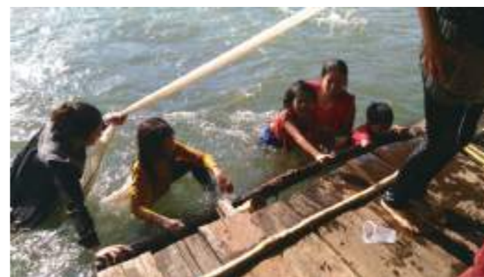
媽媽、妹妹、我和、舅舅去柬埔寨的湄公河玩水和吃東西