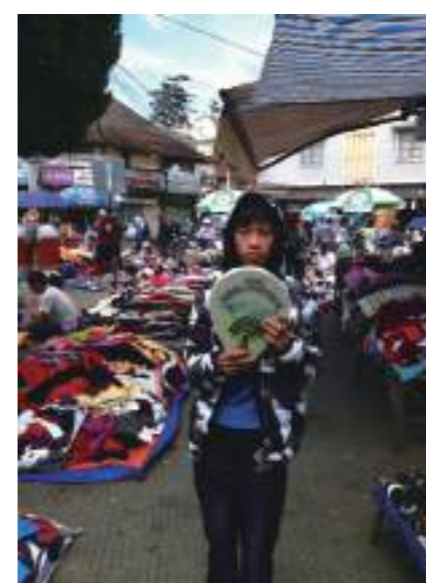
在越南參觀傳統市場

這趟旅程能讓我學到很多東西，例如：廟宇拜拜文化、傳統市場、學校、語言交流還有我覺得最特別的是有收到很多紅包，在越南春節文化是每到親戚家他們都很熱情的招待，會發紅包給每位小朋友。這趟旅程真的很值得，能讓我好好了解越南的文化和美食。回國之後在班上跟同學分享，在越南的經過及一些有趣的越南文化和語言交流，臺下的同學一直發問，我都一一解答，還帶回越南名產邀果跟大家分享。