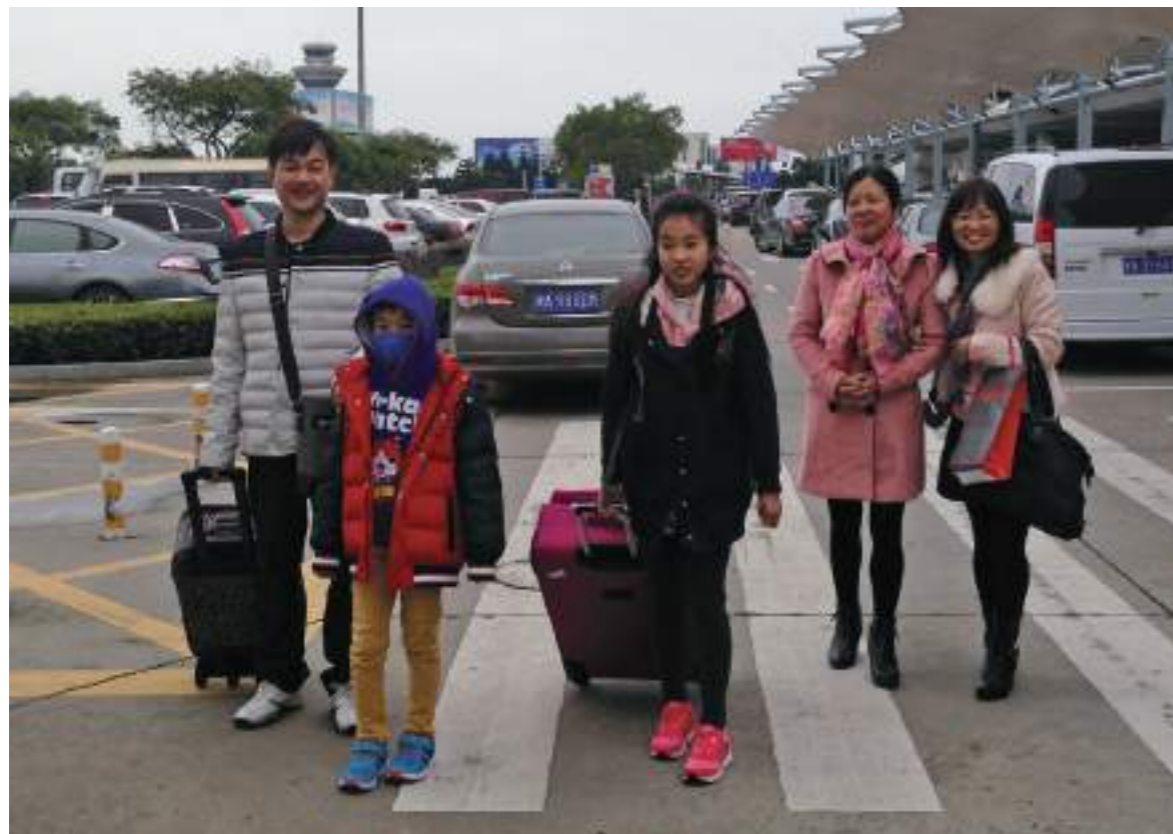
外婆及在上海工作的爸爸來福州長樂機場接機