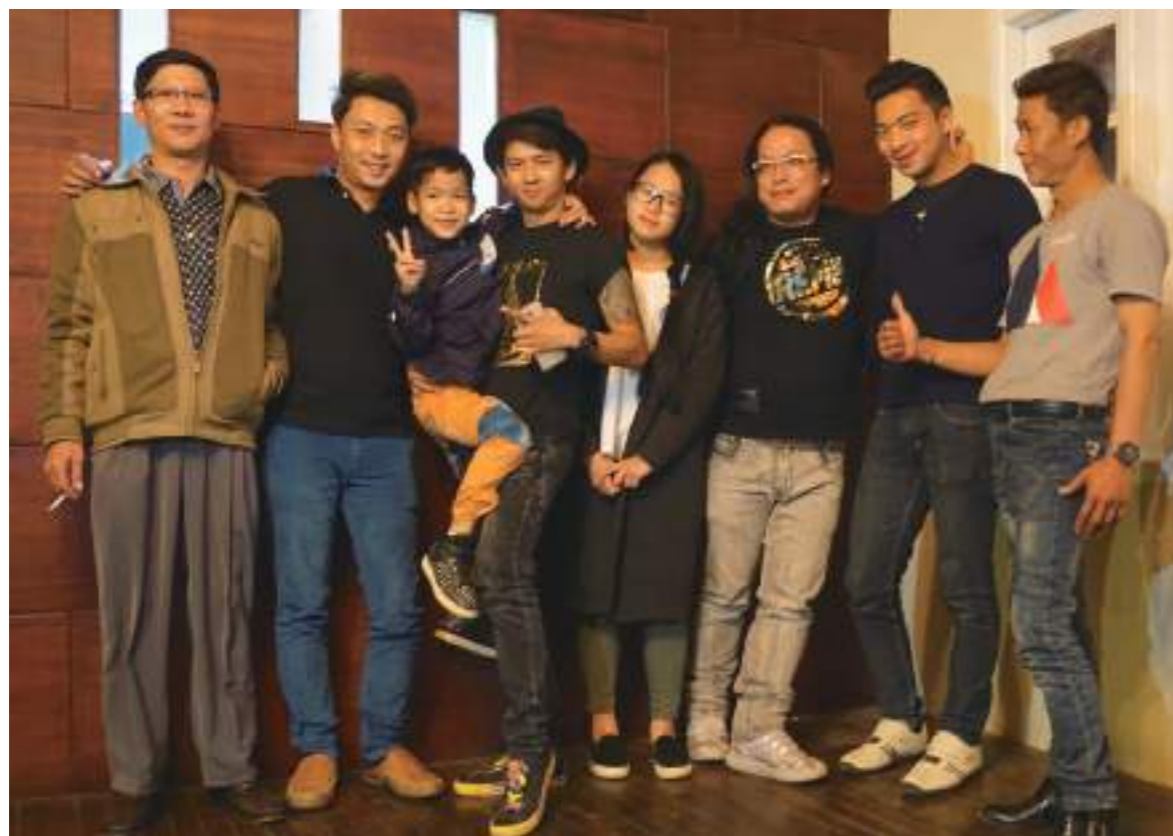
和緬甸的家人們合照