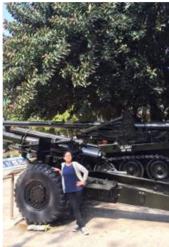
胡志明市戰爭遺跡博物館，分別為我與和媽媽