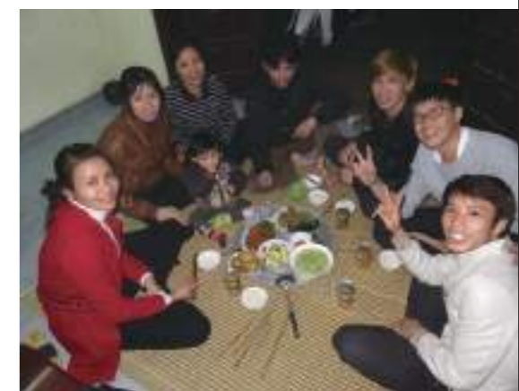
為回北越和親戚們一起吃飯

自己本身更加珍惜越南人的情感，也更想將在他們身上所看見的親族之間強烈情感連結性，推廣在自己的家庭中。能夠更聽懂他們在說什麼，也能用更流利的越文與他們對話，讓自己在越語學習上更有動力以及堅持。看見跨文化之差異，奠基於此，進行更好的跨文化溝通，而非依舊用臺灣的行為思考模式套置在越南上。