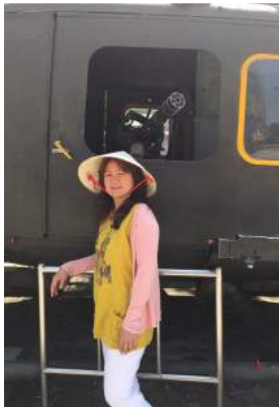
我們在胡志明市的戰爭遺跡博物館看見越南的歷史