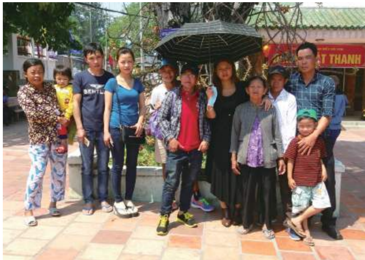
本張照片是在當地很有名的一種「媽祖廟」，香火鼎盛，大家都很虔誠的拜神明。照片裡的人物有外婆、舅舅、阿姨、堂弟、堂妹和姊夫。