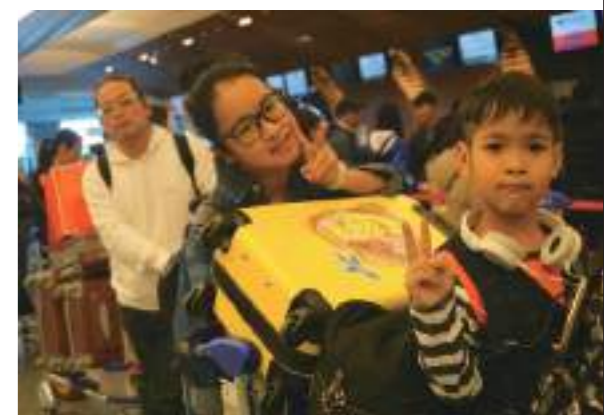
準備要坐飛機回媽媽的故鄉

回到了臺灣我迫不及待的想把我在緬甸看到的東西說給朋友們聽，所以就利用了班會課的時間來報告，也當作了之後在學校很多新住民活動要上臺的小小練習，雖然大家都是認識的人，但還是有點小害羞啦，不過比我預期的還要順利，這次的報告因為上述的原因我不是講我去緬甸做了什麼而是想要讓大家初步的了解緬甸，所以就用 ppt 比較簡單的方是呈現，我分別從食衣住行來簡單的講緬甸會看到比較有趣的東西，讓同學們知道假如要去緬甸旅行時會遇到什麼有趣的事或會遇到什麼樣的麻煩，使大家對緬甸產生興趣。