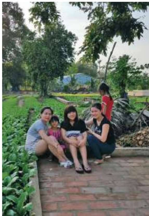
和越南的家人很多年才見一次面，讓我們更加懂得珍惜。