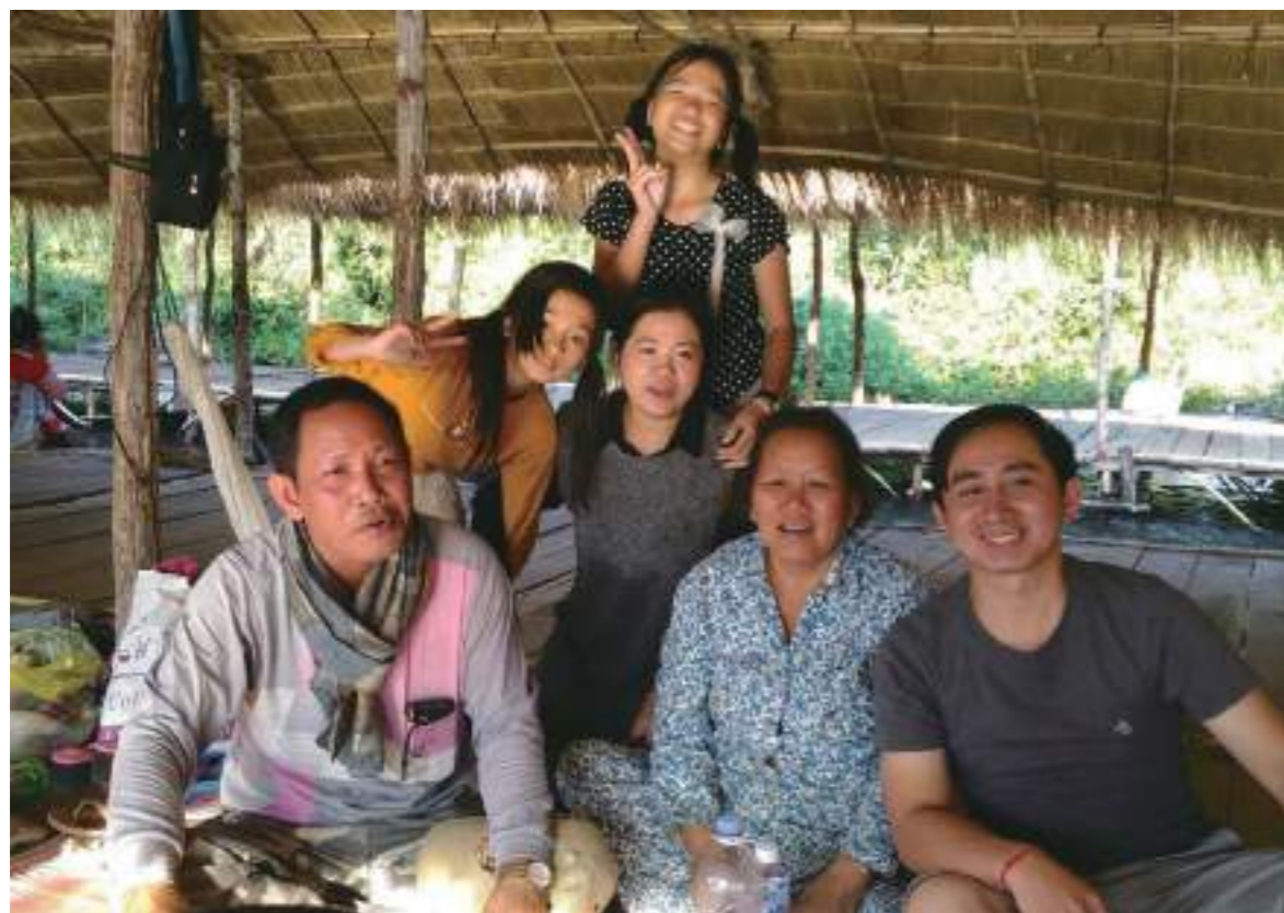
媽媽、妹妹、我和、舅舅去柬埔寨的湄公河玩水和吃東西