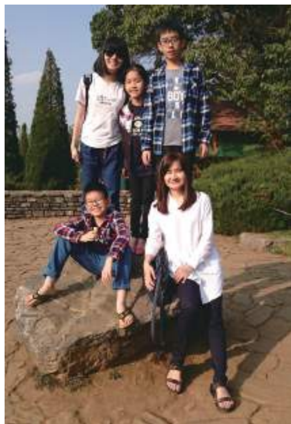
眉謬大大公園，那公園是有歷史性的大公園