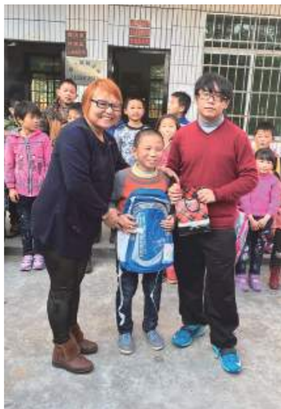
和爸媽帶著祝福卡、書包、文具和福袋，去探望偏遠地區留守兒童，和孩子們一同歡度一個不一樣的春節。