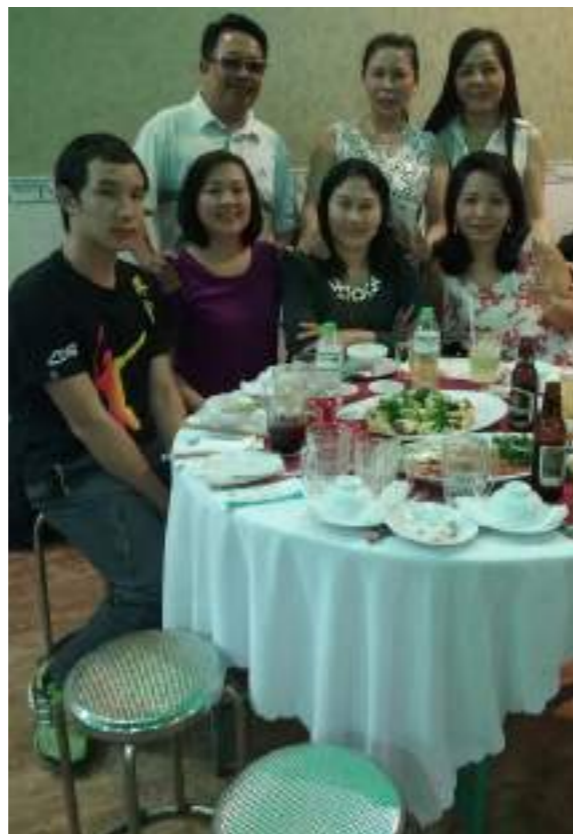
和阿姨去參加阿姨朋友的婚宴拍的，左前第一個和第二個分別是我 and 阿姨，其他是阿姨的朋友。