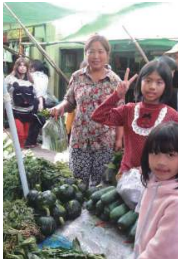
除夕早上去市場購買年菜。