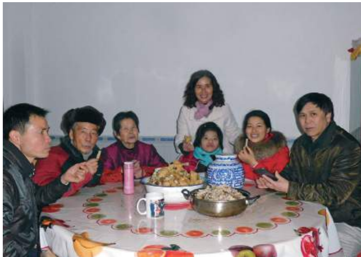
和緬甸的家人們合照