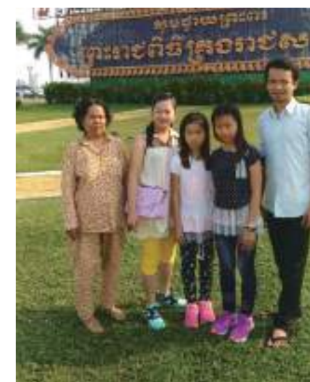
媽媽、妹妹、我和外婆、舅舅去柬埔寨皇宮裡面的鴿子廣場，餵鴿子