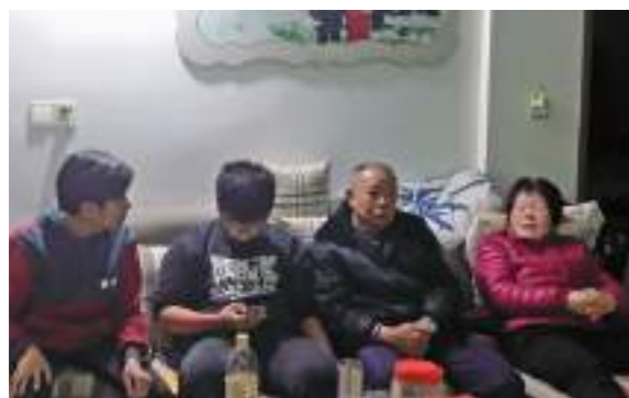
和爺爺奶奶一起聊天看電視