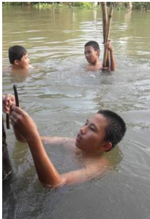
在外公家前面的河流玩水