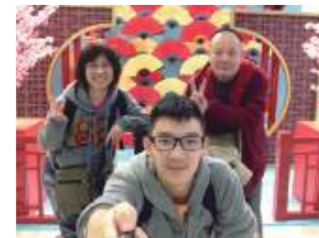
1/30 抵達澳門機場出關，澳門關關充滿過年的年節氣氛！