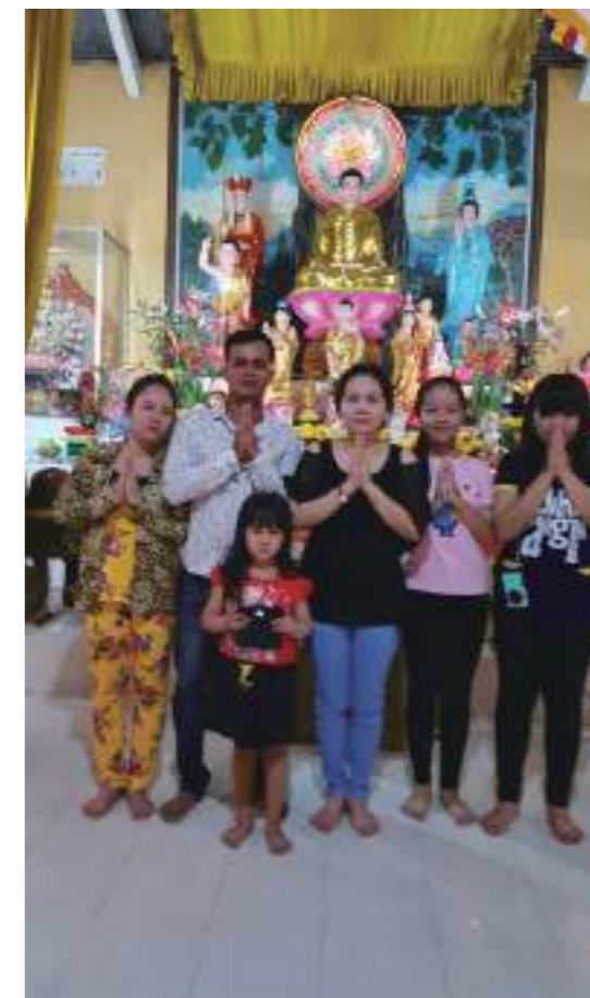
過年初一和家人一起去廟裡拍照求平安

我們也很珍惜彼此在一起的時間，很多年見一次面，讓我們更加懂得珍惜，最重要的是在臺灣學的遠比不上這趟旅程的收穫。在臺灣學越南話，遠比不上回去那裡一個月所學的，環境的因素使我的越南話進步神速，而且越南字也越看越多，根本沒想到，才短短一個月的時間，我竟然進步這麼多。原本我也沒把越南話看的很重要，但是因為這趟旅程，我發現越南真的對我影響很大，也了解到學習的越多對自己越有幫助。