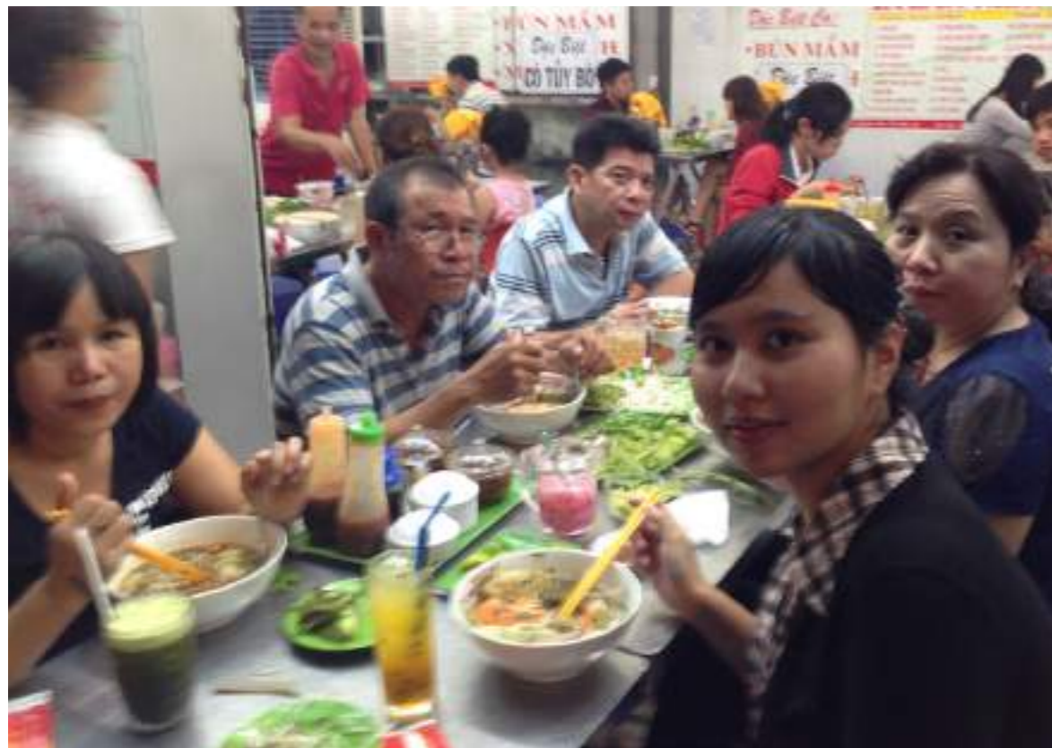
和越南家人一起出外吃晚餐