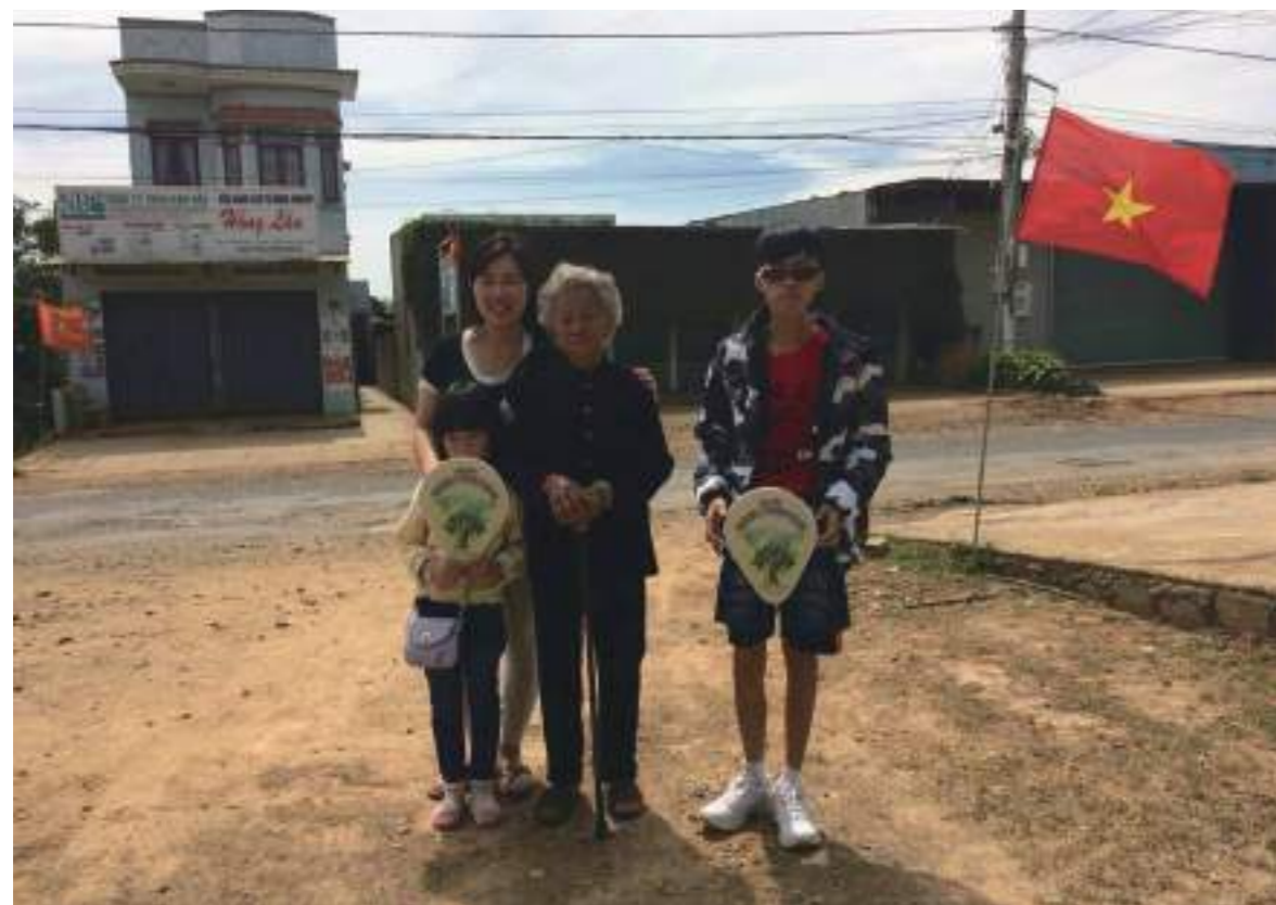
探望媽媽的外婆(阿祖)