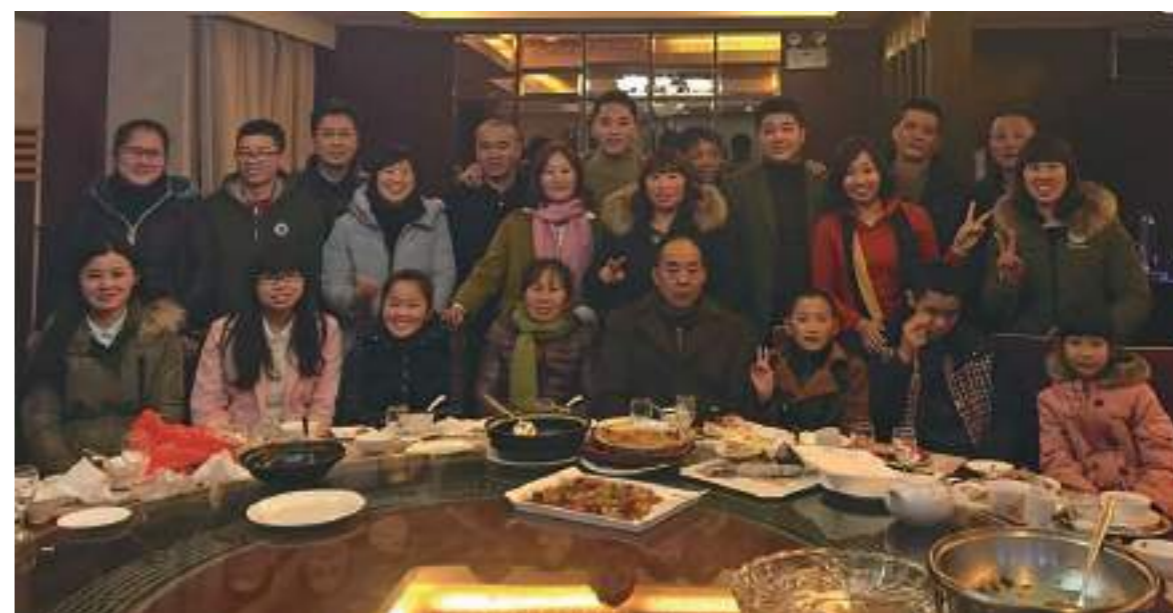
跟家人一起用餐，感受與臺灣不同的年節氣氛

此次的旅程讓我們體驗了海上直航「臺北淡水八里——福建平潭」。冬天的風浪坐船讓人既期待又怕暈船，最後還真是經歷了氣候不佳船期一再延後跟飽受暈船之苦。經過了三個半鐘頭的航程終於到了日思夜想的娘家，孩子的外婆家，在平潭度過了快樂的寒假，享受了與外公外婆及家人團聚圍爐，讓寶貝們感受跟臺灣不同的年節氣氛，同時也體驗了不同地方不一樣的習俗與信仰。幸福快樂的時間總是過得特別得快，寒假的假期轉眼已經結束，我將帶著娘家家人滿滿的祝福與關懷起程回來我的第二個家——臺灣，再一次感謝政府的德政給予新住民滿滿的幸福與關懷！