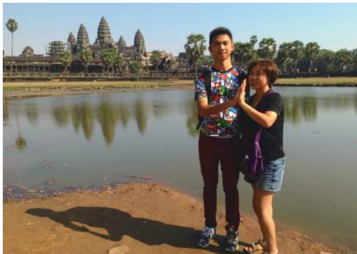
探訪吳哥窟歷史古蹟